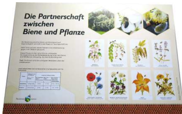
Die Partnerschaft zwischen Biene und Pflanze