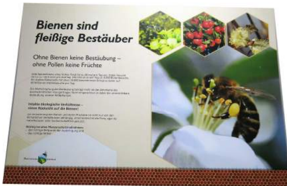
Bienen sind fleißige Bestäuber