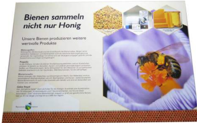
Bienen sammeln nicht nur Honig