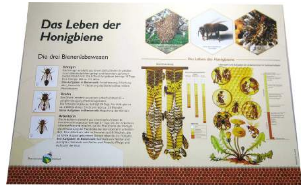
Das Leben der Honigbiene