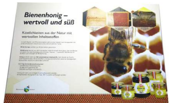
Bienenhonig – wertvoll und süß