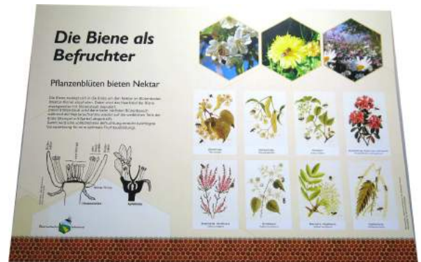
Die Biene als Befruchter